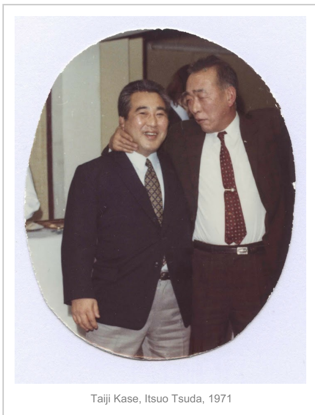
Taiji Kase, Itsuo Tsuda, 1971

«Il Maestro Ueshiba ha piantato dei segnali indicatori »è da questa parte », e gliene sono molto riconoscente. Ha lasciato delle eccellenti carote da mangiare che cerco di assimilare, di digerire. Una volta digerite, queste carote diventano Tsuda che è ben lontano dall'essere eccellente. Questo è inevitabile. Ma è necessario che le carote non restino carote, se no marciscono da sole, senza utilità.